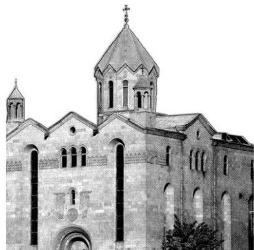
2008թ., Հունվար 1, Թիվ 1 (186)

ՀԱՅ ԱՌԱՔԵԼԱԿԱՆ ՍՈՒՐԲ ԵԿԵՂԵՑՈՒ ԱՐԱՐԱՏՅԱՆ ՀԱՅՐԱՊԵՏԱԿԱՆ ԹԵՄԻ ՊԱՇՏՈՆԱԿԱՆ ԵՐԿՇԱՐԱԹԱԹԵՐԹ