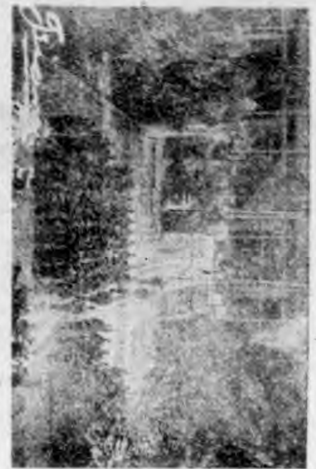
1. 升旗典禮于南嶽殿前奉行

一九三六年春奉調湖南專科以上學校編中區調干訓練本 校奉令全體同學一律參加下列各圖為其生活之一斷片 三三三隊攝