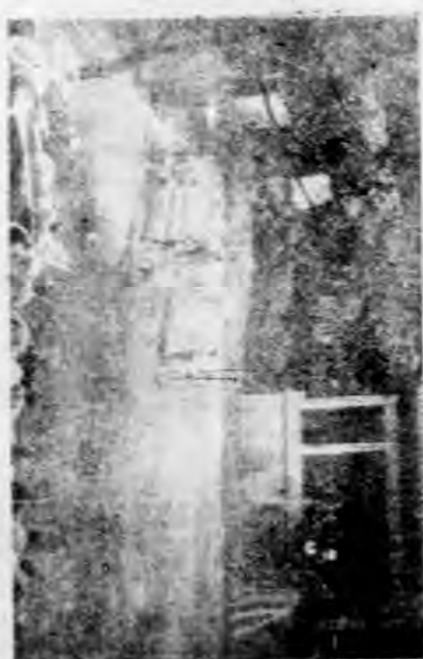
6. 本校與湖南大學籃球比賽最緊張之一幕