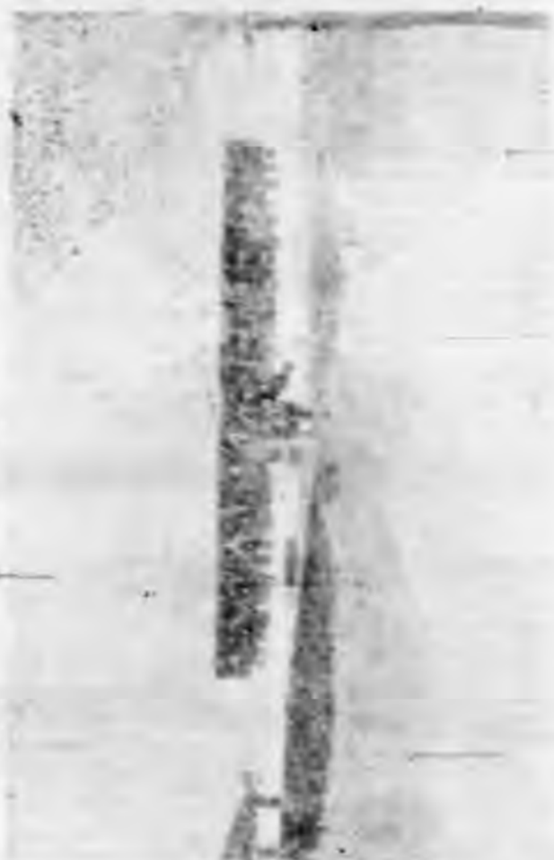
5. 操息後休息之情形